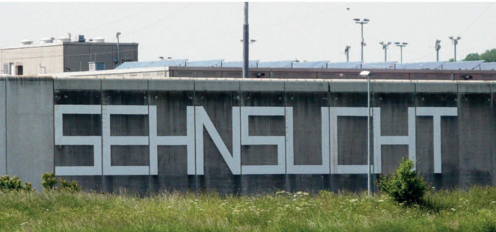
Projekt »KUHnst«, JVA Geldern

ken und ist im Fachausschuss Forensik der DGSP vertreten.