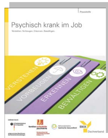
Abb. 4: Psychisch krank im Job - Praxishilfe

Ziel ist es, für das Thema zu sensibilisieren, psychische Erkrankungen zugänglicher zu machen und Ängste und Vorurteile abzubauen – um psychischen Störungen vorzubeugen und den Umgang mit Betroffenen zu erleichtern. Die Broschüre kann im Bundesverband bestellt werden.